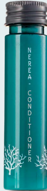
Balsamo 40ml e fl.oz 1,35 Cod.NRBL40F

Una spiaggia rilassante e selvaggia è l'immagine evocata da un balsamo corposo che districa e nutre i capelli, arricchito con le essenze di agrumi e vetiver.