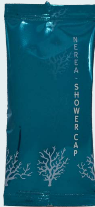
Cuffia Doccia Cod.NRCDFF

La cuffia doccia Nerea, parte della linea in flow-pack, è un accessorio utile e pratico, imbustato singolarmente e stampato con le nuove tecnologie touch, che creano una sensazione tattile di alta qualità.