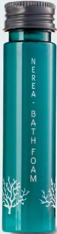
Bagnoschiama 40ml e fl.oz 1,35 Cod.NRBS40F

Un bagnoschiama, che grazie ai principi emollienti e idratanti, deterge e dona morbidezza.